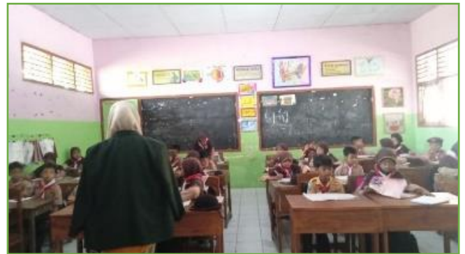
Kegiatan KBM di SDN UPT 310 Gresik