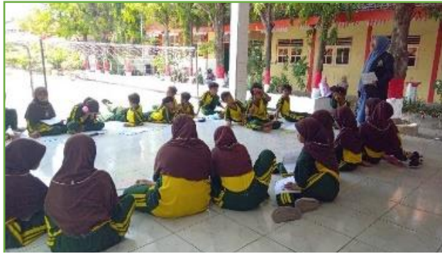
Kegiatan KBM outdoor di UPT SDN 310