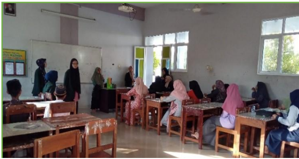
Kegiatan Pendampingan Eksibisi 2 Bahasa pada siswa Mts