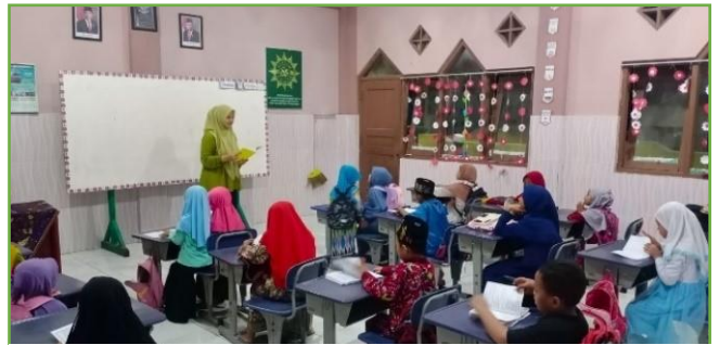
Kegiatan Pendampingan TPA Muhammadiyah