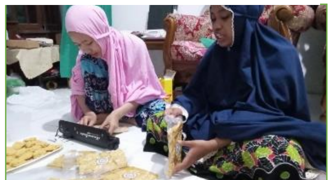
Persiapan bursa inovasi berupa nugget ikan tongkol