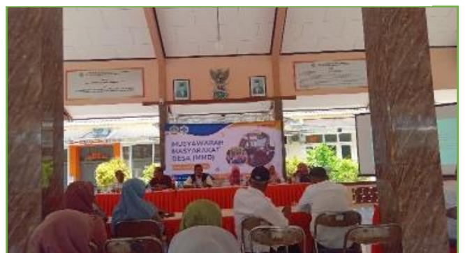
Kegiatan pendampinga MMD(Musyawarah Masyarakat Desa) di Balai desa