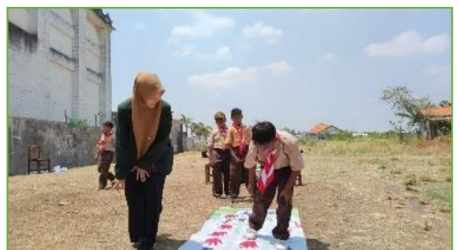
Kegiatan lomba memperingati HSN