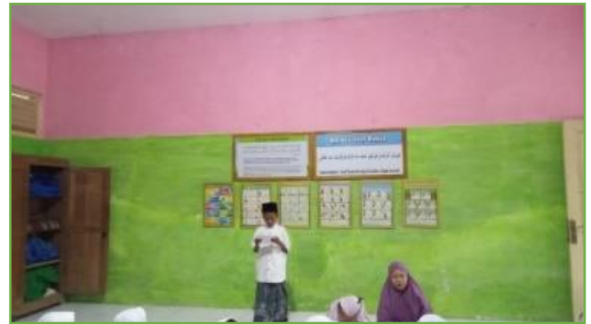
Kegiatan KBM di UPT SDN 310