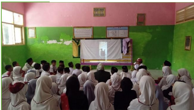
Nobar bersama siswa SDN UPT 310 Gresik