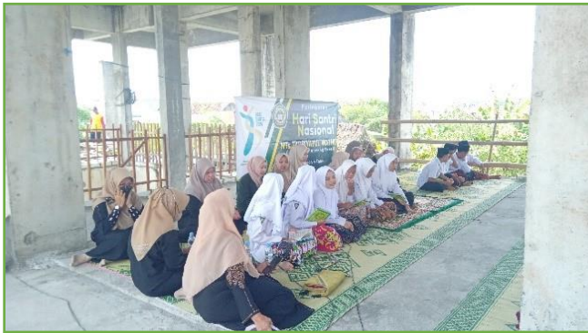
Kegiatan pembacaan Diba' memperingati Hari Santri Nasional bersama siswa Mts. TAWON