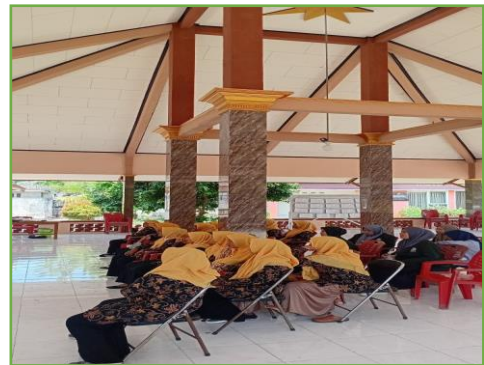
Kegiatan sosialisasi selepas kegiatan POSYANDU