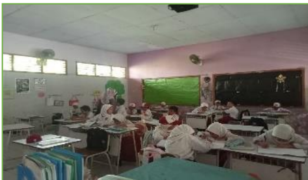
Kegiatan KBM indoor di UPT SDN 310