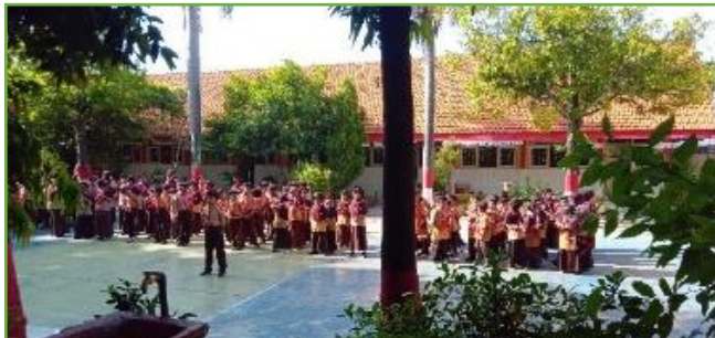
Kegiatan pendampingan pramuka UPT SDN 310 Gresik