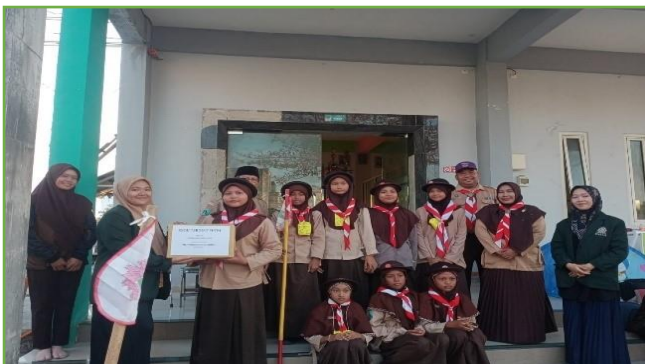
Kegiatan pendampingan PERJUSA di MI TAWON