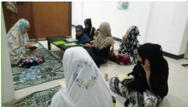
Kegiatan pembacaan diba' di Musholla Kal Bakal