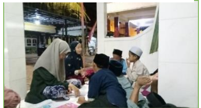
Kegiatan BIMBEL anak usia MI/SD