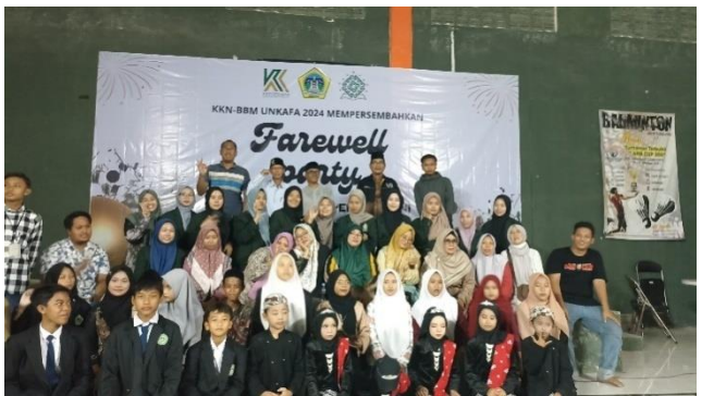
Acara perpisahan bersama perangkat desa dan bapak ibu lembaga desa