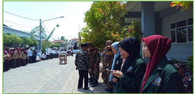
Kegiatan pendampingan kirab koin sehat NU di Yayasan Tarbiyatul Wathon