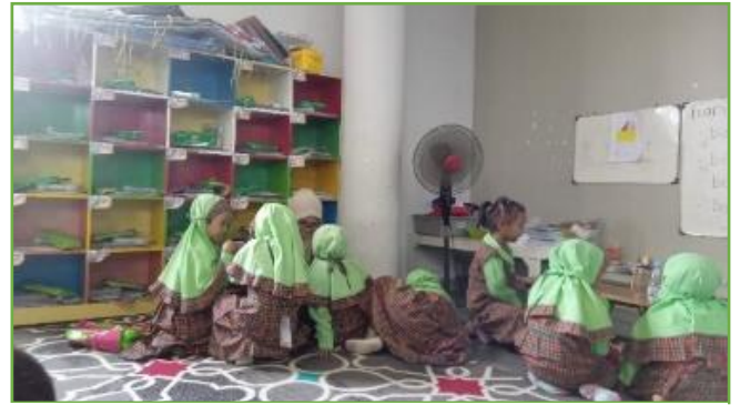
Kegiatan KBM di TK RA Tarbiyatul Wathon