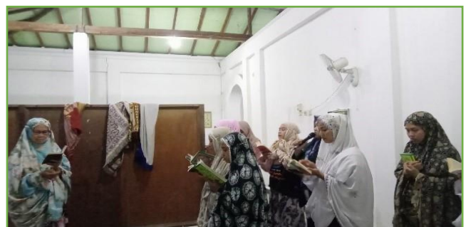
Kegiatan pembacaan Diba' bersama warga di Musholla Kal Bakal