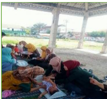
Kegiatan pendampingan POSYANDU di Karangtumpuk