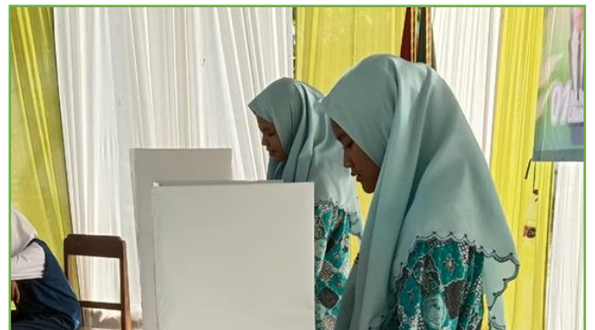
Kegiatan pendampingan pemilihan kandidat IPNU dan IPPNU