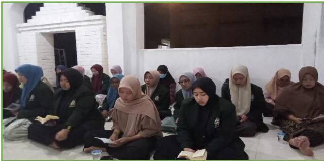
Kegiatan pembacaan Hadad bersama warga di Musholla Kal Bakal