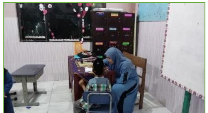
Kegiatan literasi pegon di TPA Muhammadiyah