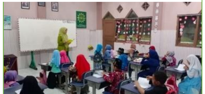
Kegiatan pembelajaran pegon di TPA Muhammadiyah