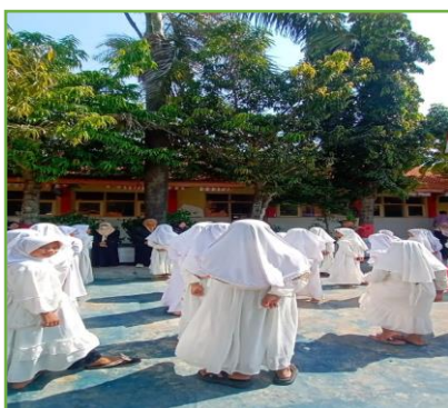
Kegiatan pendampingan wali 2 di SDN UPT 310 Gresik