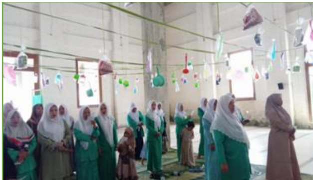
Pendampingan peringatan Maulid Nabi bersama Ibu-ibu PKK di musholla TAWON