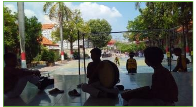
Kegiatan extra banjari di SDN UPT 310 Gresik