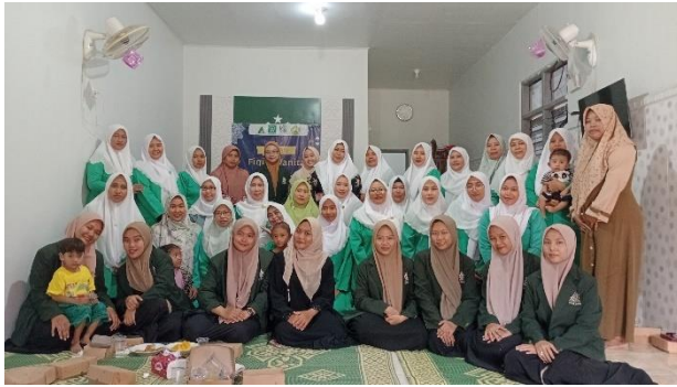
Kegiatan pengajian Fiqih wannita bersama ibu-ibu PKK dan Fatayat di lembaga NU