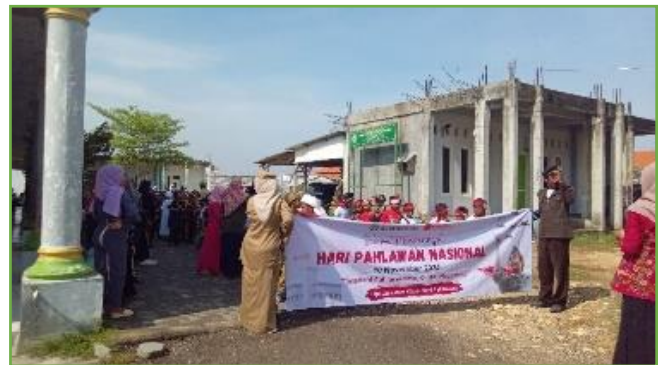
Kegiatan pendampingan karnaval memperingati hari pahlawan di MI TAWON