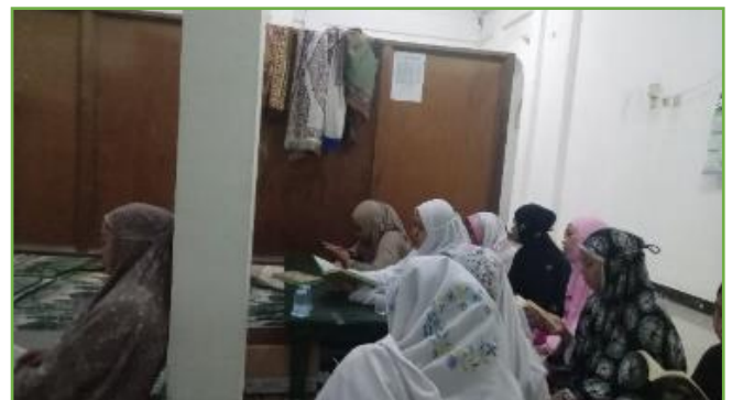
Kegiatan pembacaan diba' bersama warga di Musholla Kal Bakal