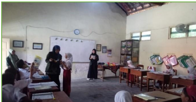
Kegiatan KBM di UPT SDN 310