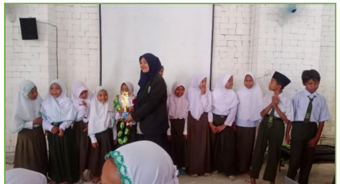
Pembagian Hadiah memperingati HSN di MI TAWON