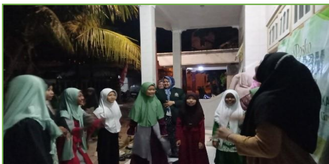
Kegiatan pendampingan BIMBEL usia SD/MI di posko