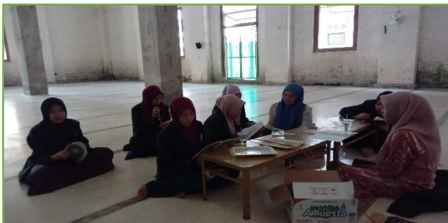
Kegiatan pembacaan Tadarrus Al-Qur'an di Musholla Tawon