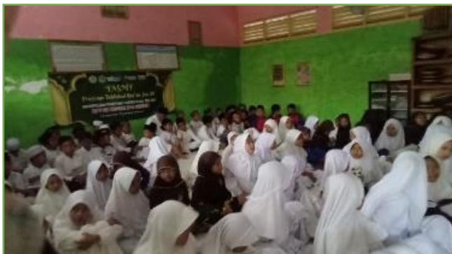
Kegiatan sosialisasi di UPT SDN 310