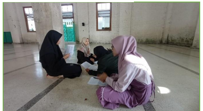
Persiapan eksebis bahasa untuk acara perpisahan