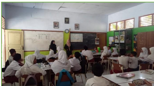
Kegiatan pendampingan belajar mengajar di UPT SDN 310 Gresik