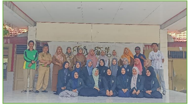
Acara perpisahan di SDN UPT 310 Gresik