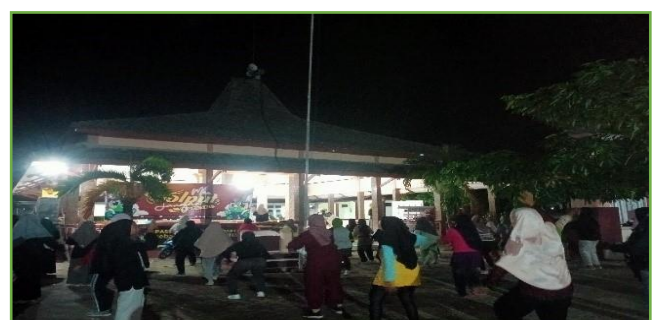
Kegiatan pendampingan senam bersama ibu-ibu di Balai desa