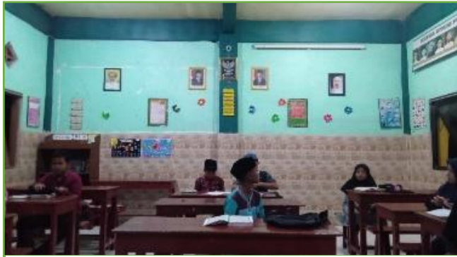
Kegiatan KBM MI Muhammadiyah